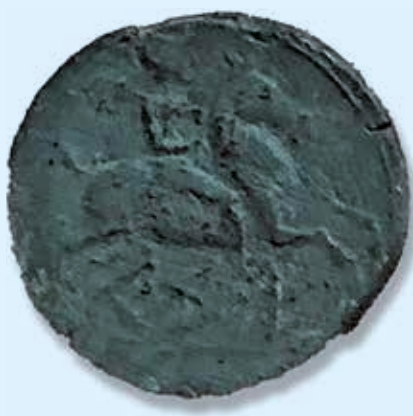
Mesures: 24 mm i 11,4 g Descripció: cap masculí amb mantell al coll i genet amb palma.