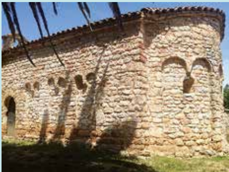
Ermита de Santa Margarida d'Agullàdols, per on passa el Camí Ramader de la Marina.