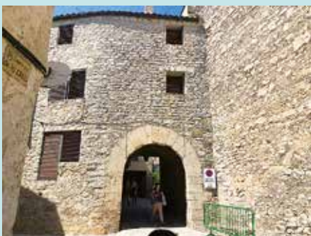
Portal dels Bens de La Llacuna per on entraven els ramats.