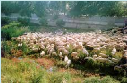
Ramat de 200 bens a la Riera el 1989.

Baixaven a la tardor, per Tots Sants, abans de les nevades i pujaven a la primavera, a finals d'abril, amb la fosa de les neus a l'alta muntanya. El viatge durava de 10 a 15 dies.