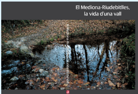
Coberta del llibre

Com diuen al Delta de l'Ebre: LO RIU ÉS VIDA.