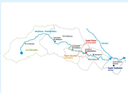
Recorregut del Mediona-Riudebitlles